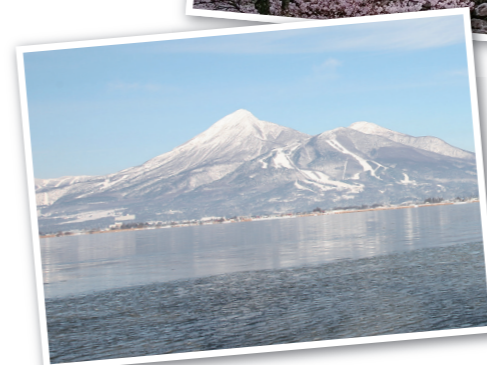
磐梯山と猪苗代湖