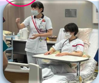
摂食嚥下水飲みテストと ポジショニングについて