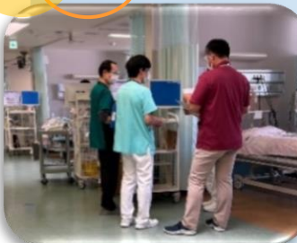
各病棟の栄養管理について （HCU）