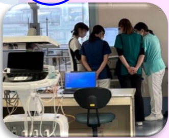
各病棟の栄養管理について （ICU）