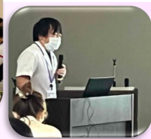
各種カリキュラム講義