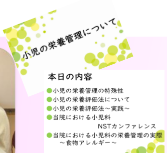
小児の栄養管理について