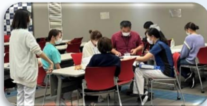
リフィーディング症候群の 症例検討