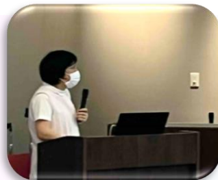
口腔ケアについて