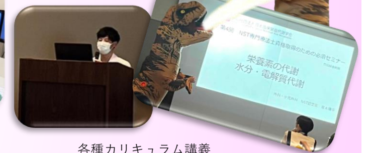
各種カリキュラム講義