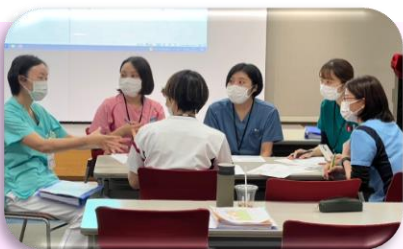
腎疾患症例検討会