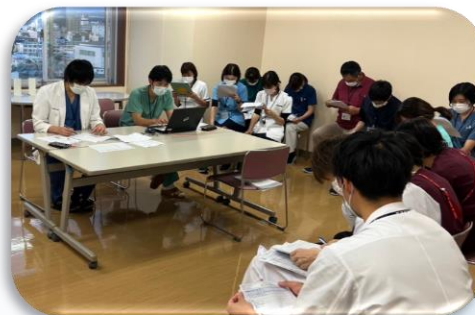
外科NSTカンファレンス