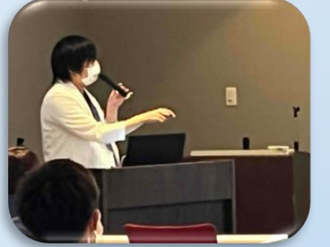
各種カリキュラム講義