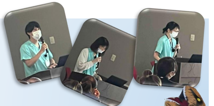
各種カリキュラム講義