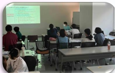
周術期の症例検討