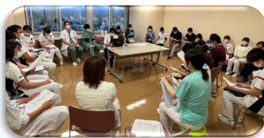
耳鼻咽喉科NSTカンファレンス