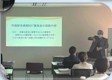
当院におけるNST活動 （ATTACK）