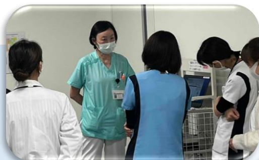
化学療法中の食事サポート がん悪液質の栄養管理について