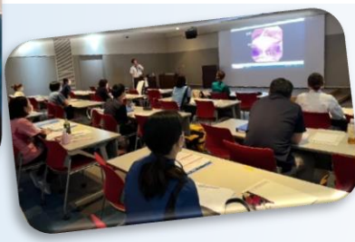
摂食嚥下について