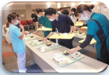
病院食・ONSについて （試食）