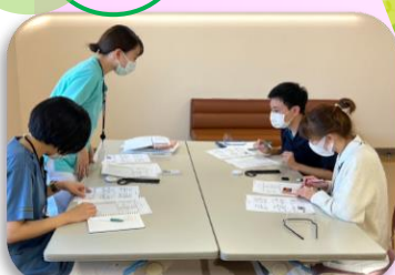
各病棟の栄養管理について （8西外科・耳鼻咽喉科）